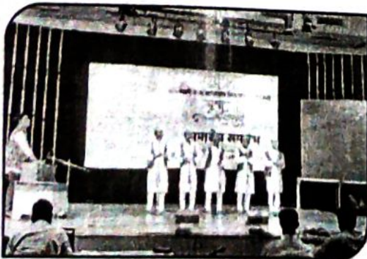
संत गाडगेबाबा विद्यापीठांतर्गत झालेल्या युवा महोत्सवामध्ये समूहगीत या कलाप्रकारात महाविद्यालयातील चमुचा प्रथम क्रमांक